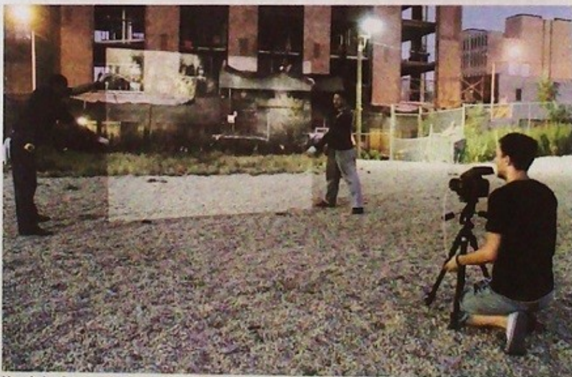
Una de las fotografías del 'making off' del proyecto de Carlos Irijalba, en Nueva York.

De esta guisa, Adriana se ha dedicado principalmente a actuar con la compañía de payasos infantil Zirko típi, que representa en euskera y en castellano, con la que ha actuado en Pamplona y también fuera, en ciudades como Salamanca o Madrid.