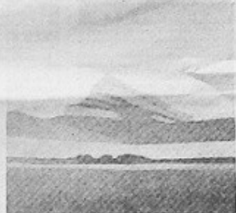
'Ukerdi', 'Anie' y 'Peña Oroel' son las propuestas paisajísticas del pintor navarro Pedro Salaberrí.