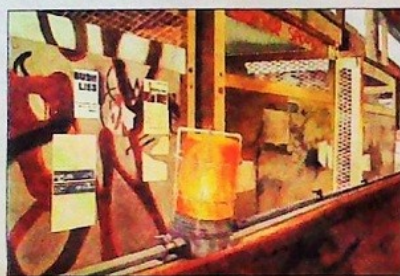
Doodle Spook!!!, acuarela de Miguel Leache.