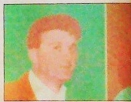
Retratos de familia, obra de Ignacio Muro